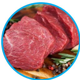
wysokiej jakości mięso

Karma instant jest smakowita, odpowiednio kaloryczna, bogata w witaminy i mikroelementy niezbędne dla zdrowia Twojego pupila.